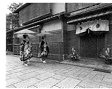
表紙写真 「祇園の正月風景」(京都市東山区、花見小路通) 京都の祇園を南北に通る花見小路通は、茶屋や料理屋など伝統的な建物が軒を並べる。整然とした石畳や電線の地中化など景観の修繕・保全が図られている。舞妓さん、芸妓さんが正月の挨拶に回る景色は、日本の風情を感じさせる。