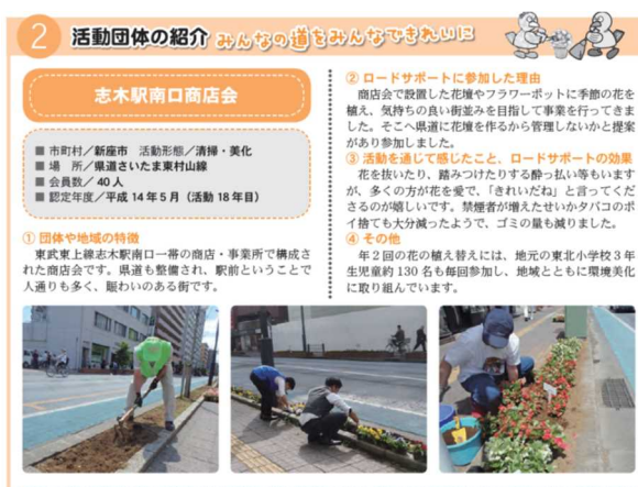
図 ロードサポートニュースにおける紹介

➢ 道の駅ガイドブック:当課で発行している道の駅ガイドブックの中で、ロードサポート制度の枠を設け、募集の案内をしている。