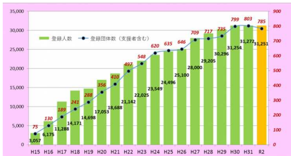
図 団数と活動人数の推移